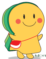
和泉市文化財活性化事業

※諸般の事情により、予告なく一部を変更・中止する場合があります。※公共交通機関を利用してお越し下さい。